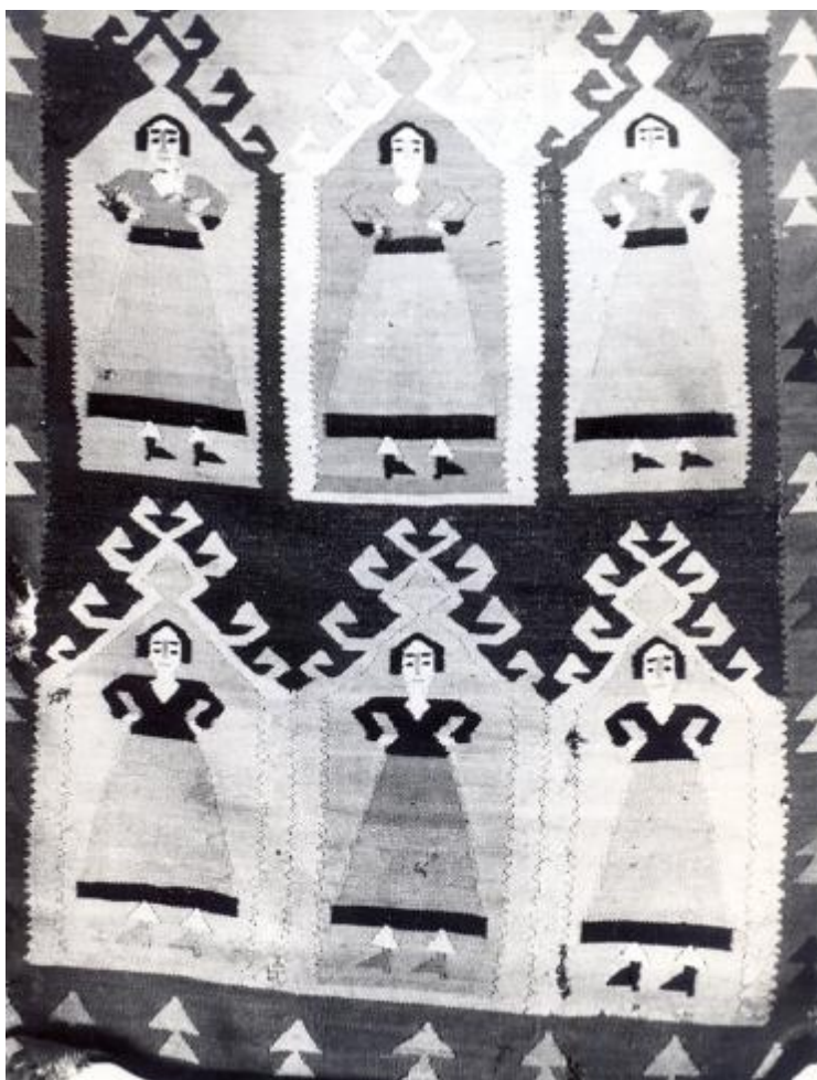
Colecția Tomaselli și E.Holban. Covor cu motive antropomorfe înscrise în nișe (fragment). Urzeala și bătaia - lână: 170/107. Pigmenți naturali. Starea de conservare: uzat. A doua jumătate a secolului al XIX-lea.

Din momentul în care se apuca de treabă, nu se mai ridica, până ce nu termina de secerat un snop de grâu. „Primul snop”, act ritual foarte important. Îl lega și de abia apoi se ridica, cu snop cu tot. În acel moment membrii familiei, care păstrasera în continuare aceeași atmosferă solemnă, izbucneau într-un chiot puternic de bucurie.