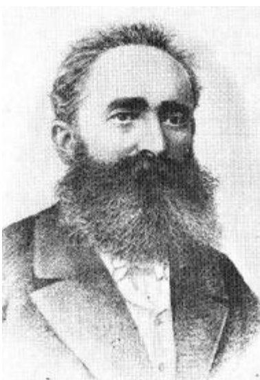
B. P. Hasdeu în anul 1884

Beneficiind de o cultură vastă și cunoașterea a nenumărate limbi străine, toate cercetările lui sunt extinse în foarte multe domenii. Un bun exemplu îl constituie lucrarea, poate cea mai reprezentativă pentru acest geniu enciclopedic, Etymologicum Magnum Romaniae , care era proiectată a fi doar un dicționar academic al limbii române.