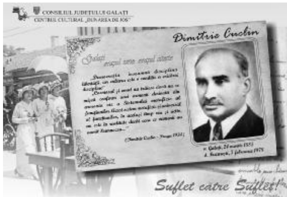
Cartea poștală dedicată lui Dimitrie Cuclin