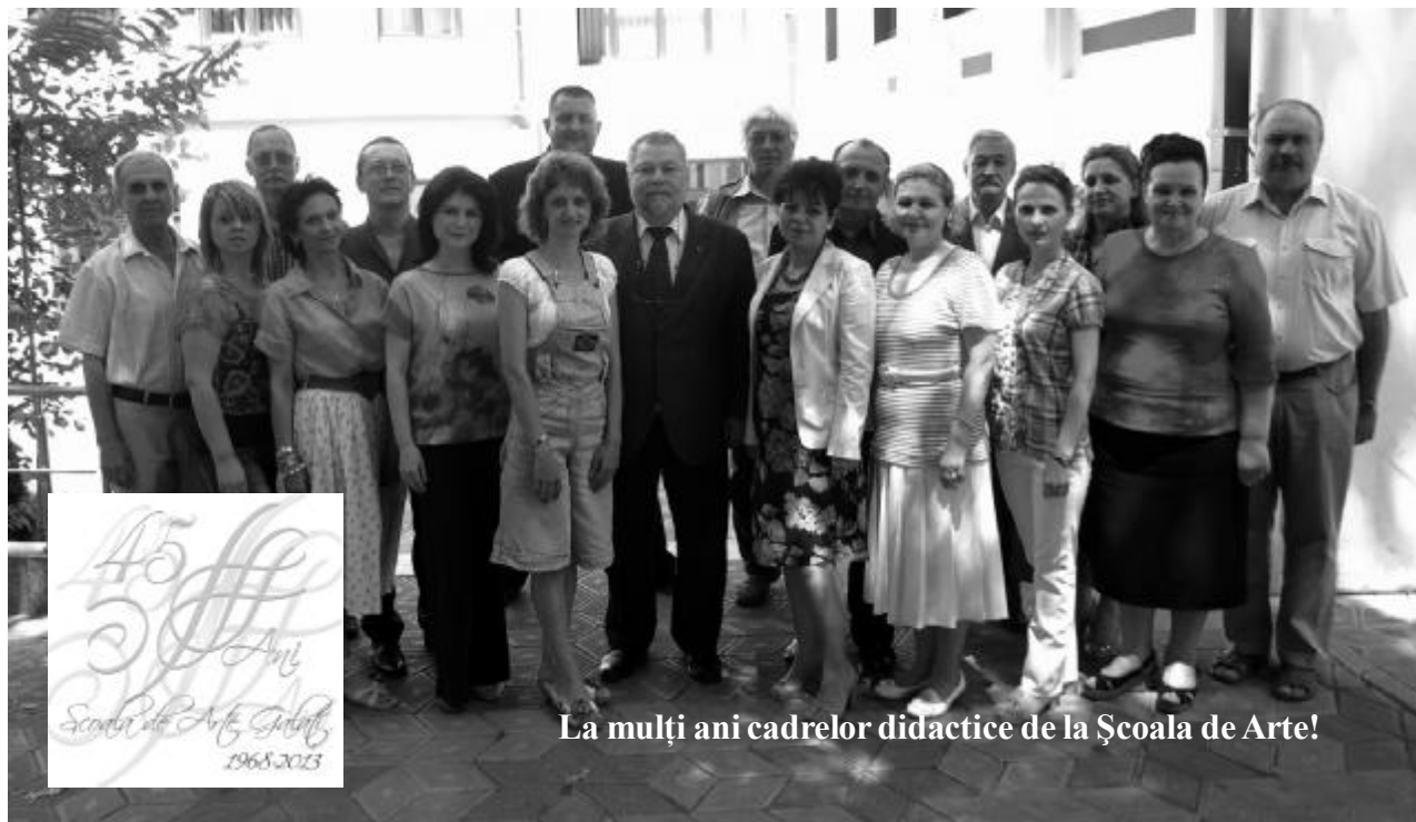
La mulți ani cadrelor didactice de la Școala de Arte!

Școala de Arte se pregătește de sărbătoare! Împlinește 45 de ani!